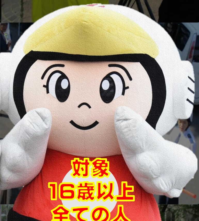
青森県警察シンボルマスコットアピーくん