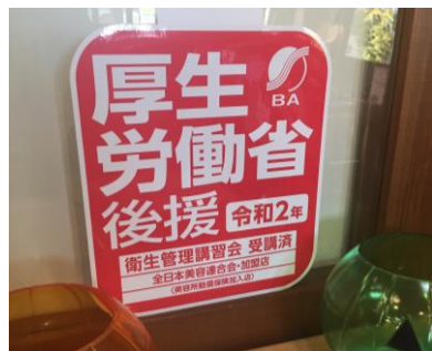
衛生講習を受けるともらえます☆