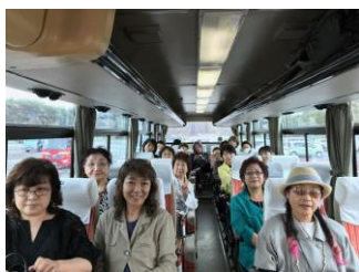
ツアーに参加された皆様